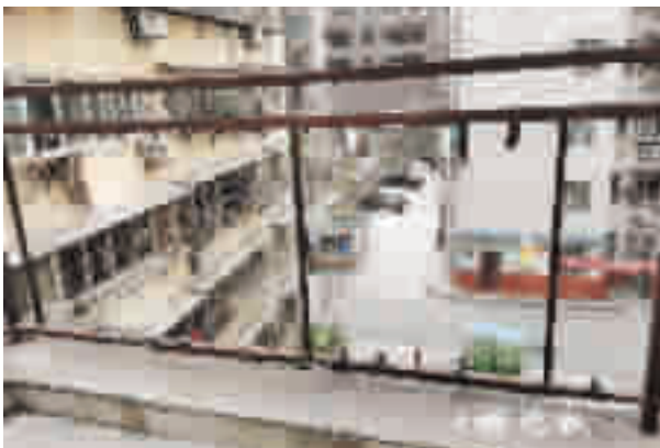
楼顶护栏锈蚀只剩铁架子。