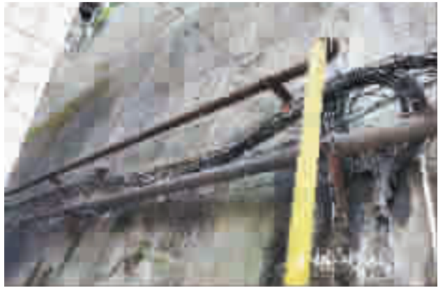
小区燃气管道生锈老化。