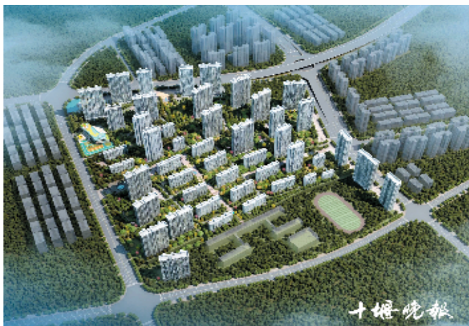
百强生态城等多个大型楼盘进驻重庆路。