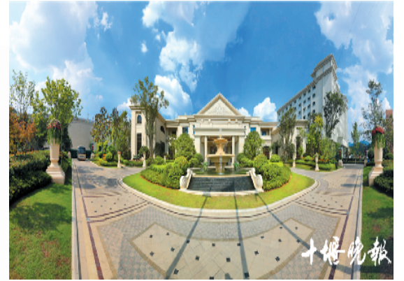
卢浮宫小区内绿化率高,环境好。