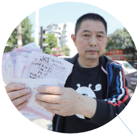
雷光炎贴告示寻债主还钱。

找到耳蜗后,妹妹的父亲陈先生将耳蜗送往武汉进行了检测,万幸的是经过简单维修,耳蜗还能正常使用。“感谢曾经帮助我寻找耳蜗的好心人,十堰因你而美丽。”陈先生感动道。