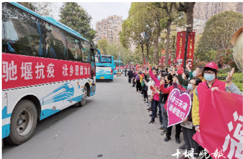
3月21日,世纪百强雅阁酒店门口,自发赶来的市民举牌欢迎广西医疗队。