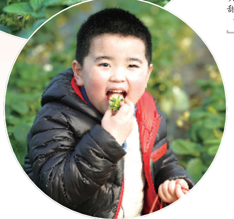
“自己动手摘的草莓更好吃哟。”