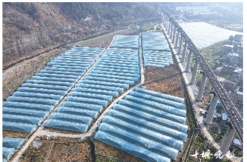
鲍湾村草莓乐园全景。