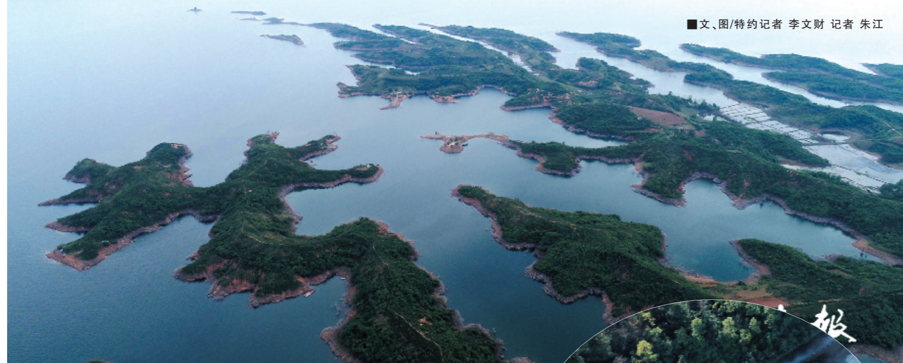
■文、图/特约记者 李文财 记者 朱江