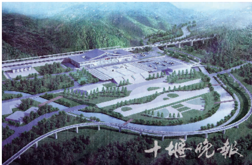
郧西站设计方案蕴含着“天河鹊桥”构思。