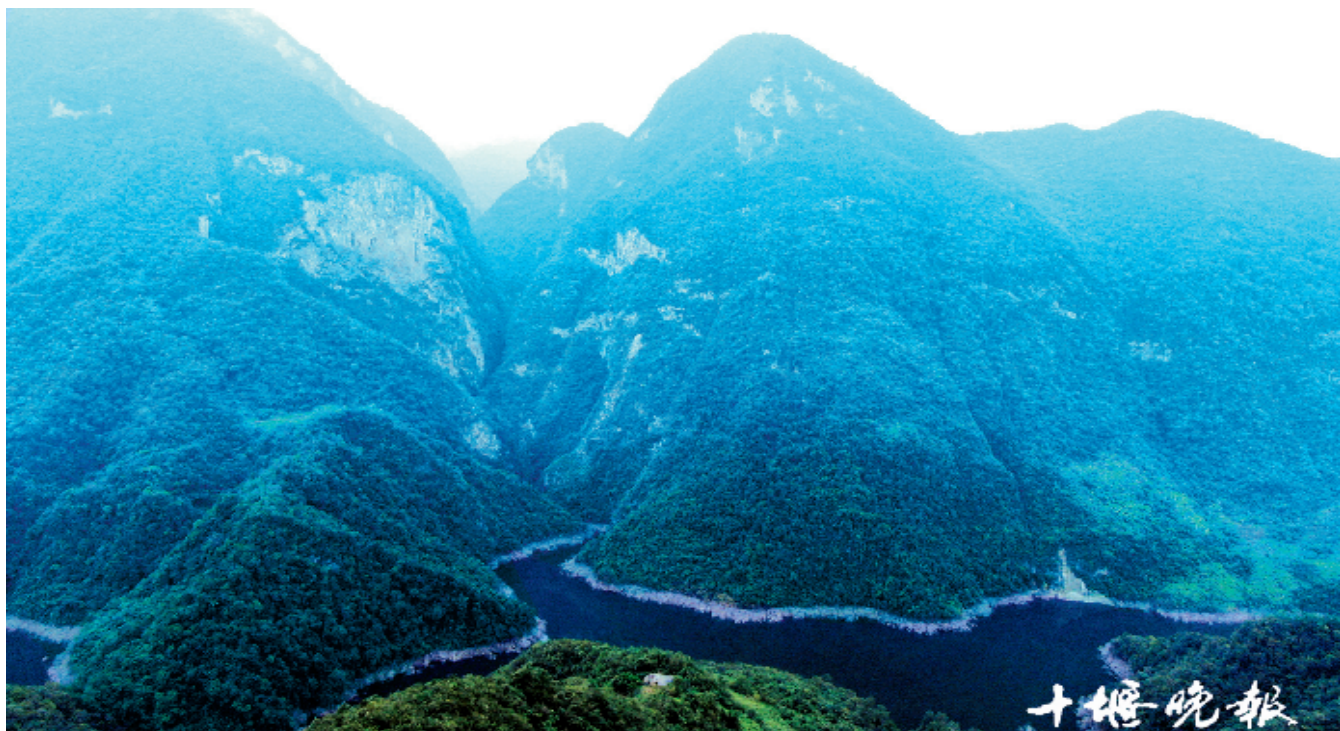
洞沟峡谷口，两旁山峰高耸入云，中间的峡谷曲折幽深。