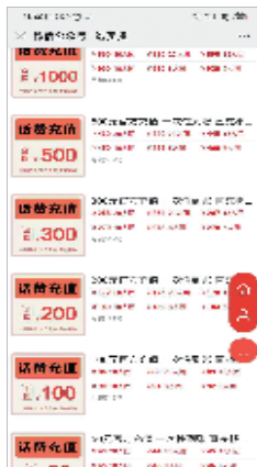
手机充值话费的拼团信息,相比正规渠道充值,该平台团购很划算。