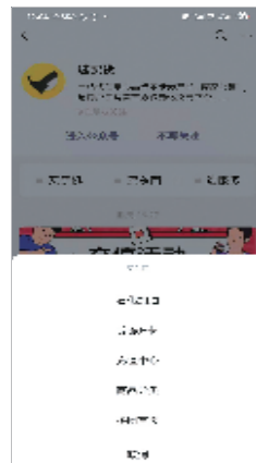
除手机话费充值团购,该公司还提供其他商品拼团。