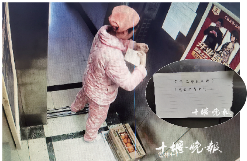
女子在电梯放了一箱橘子,并贴了一张暖心纸条。