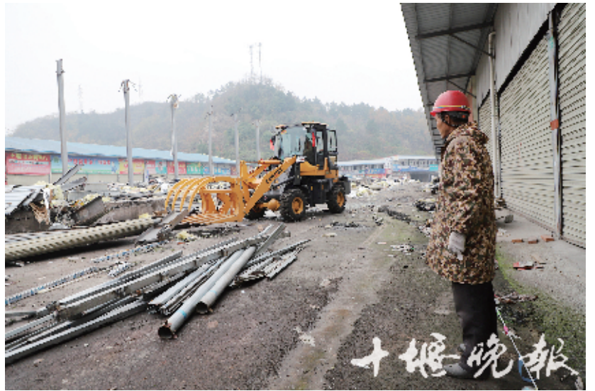
昨日,工人们正在有序拆除市场内的建筑。