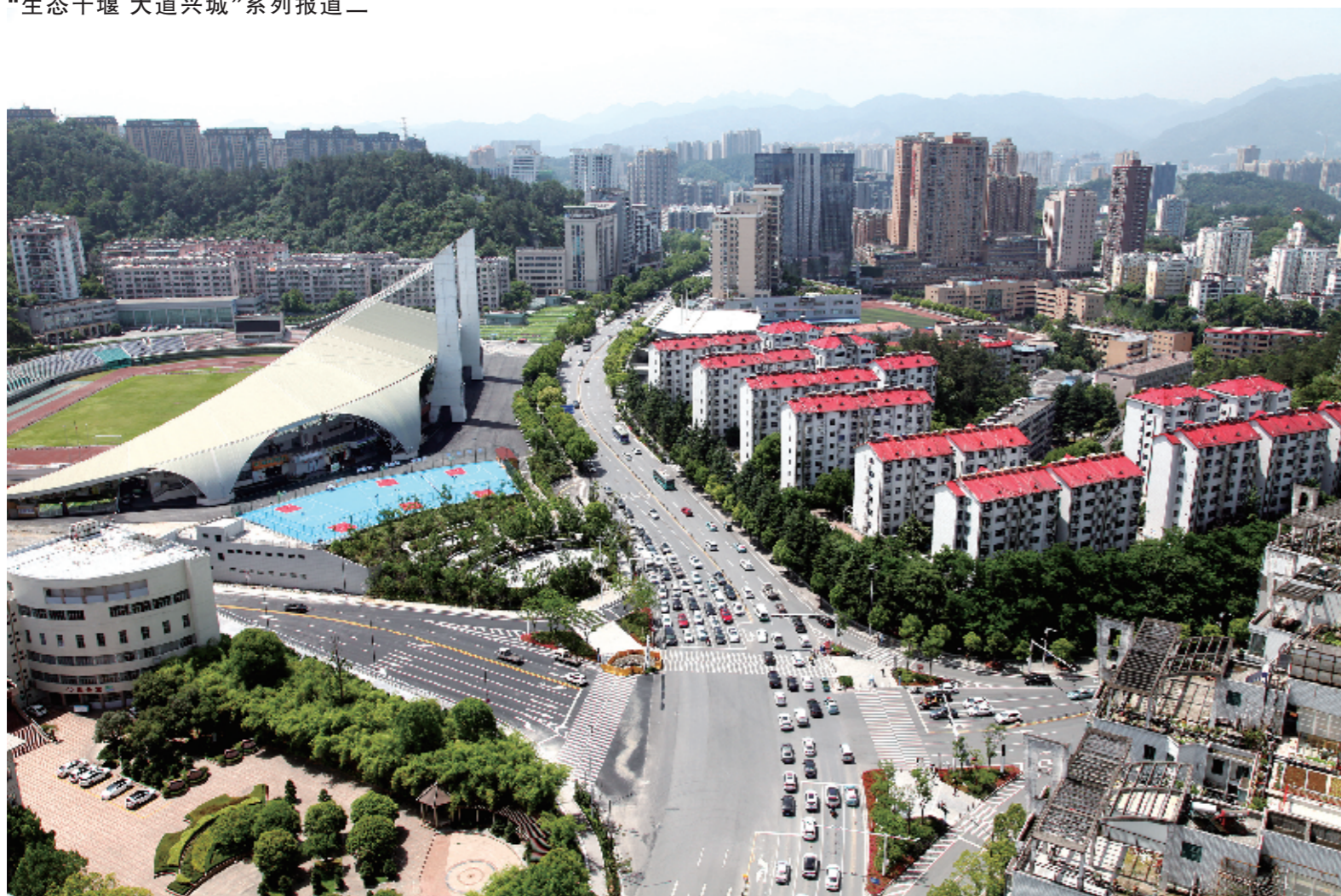
北京路改造示范段。