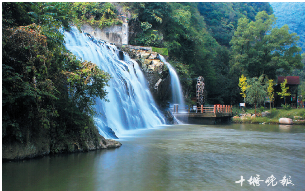
长河湾瀑布飞流泻入潭中,水珠四溅,如云漫雾绕。