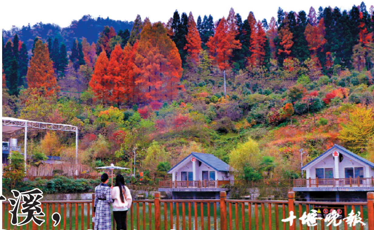
龙王坪色彩斑斓的美景。