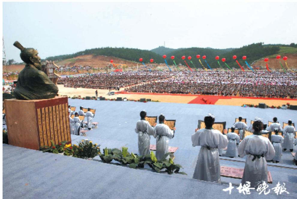
为了纪念尹吉甫和诗经文化，房县已连续多年举办诗经文化节。

在12座墓中，已确认为尹吉甫真实墓地所在地的是一座人造山，这座山就在青峰镇政府对面，古代叫尹家山，新中国成立前还有很多关于尹吉甫的墓碑，世代都有守墓人为其守墓。这个地方现名为松林垭。