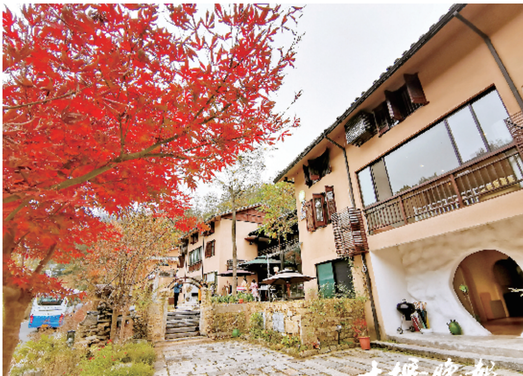
诗情画意的东沟秋色。