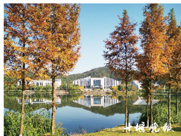
山运乾坤,水舞太极,武当山太极湖新区犹如一幅油画。