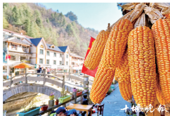
乡村的农家院子里也充满了浓浓的秋意。

十堰的秋天是短暂而诗意的,每座山、每条沟、每条路、每寸秋意都是绚烂无比,不用专门远行,在我们的身边就能邂逅最美的深秋。