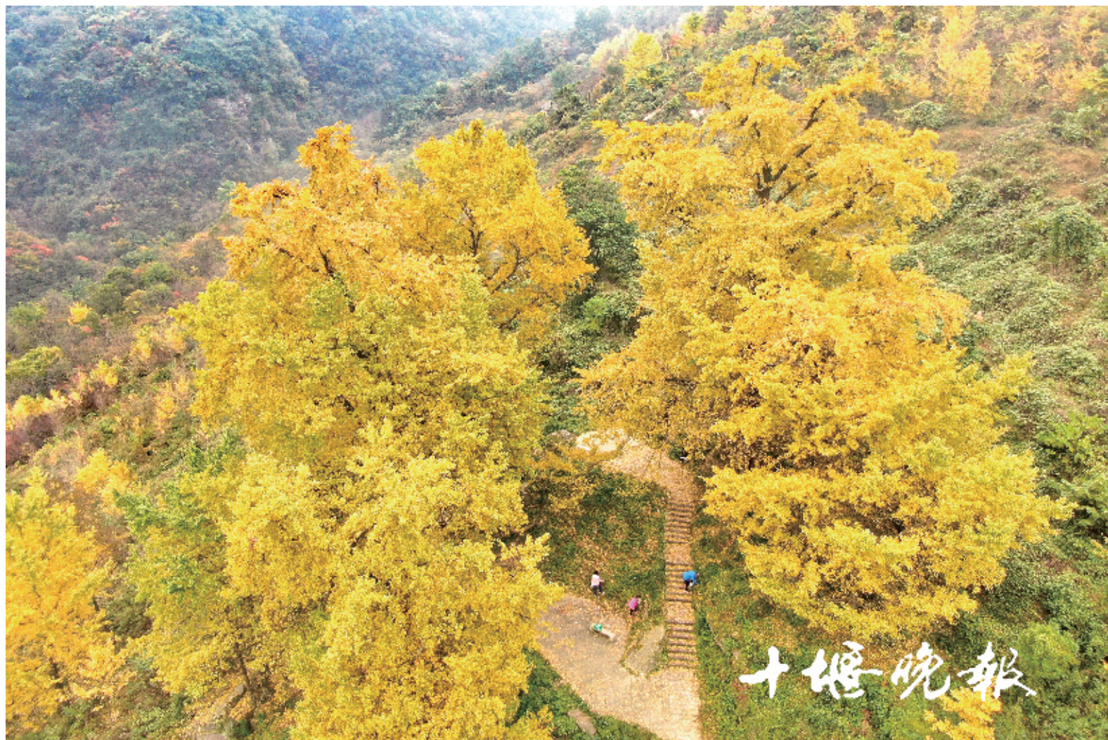
茅箭茅塔乡大沟村的几株千年银杏一片金黄,成为新晋网红点,每天都有不少游客前往打卡。