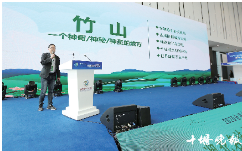
竹山通过拓展销售渠道,让特色产品走向全国。