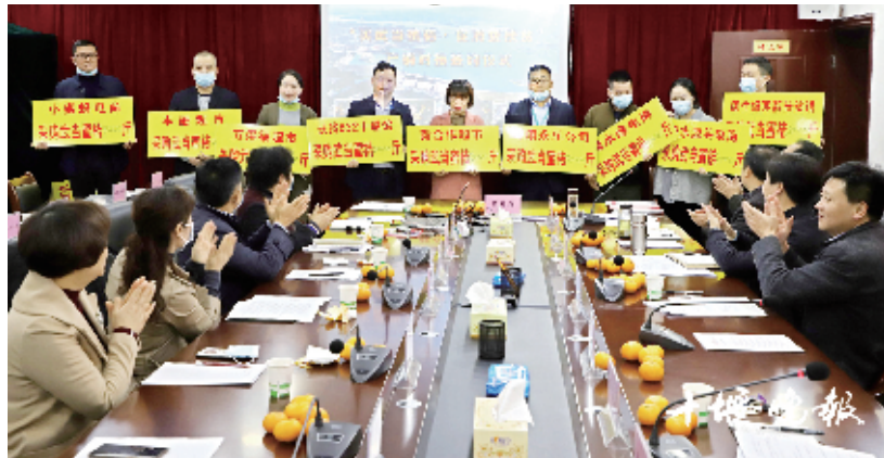
活动启动仪式上,各家经销商纷纷认购武当蜜桔。