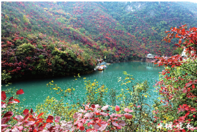
五龙河之秋。