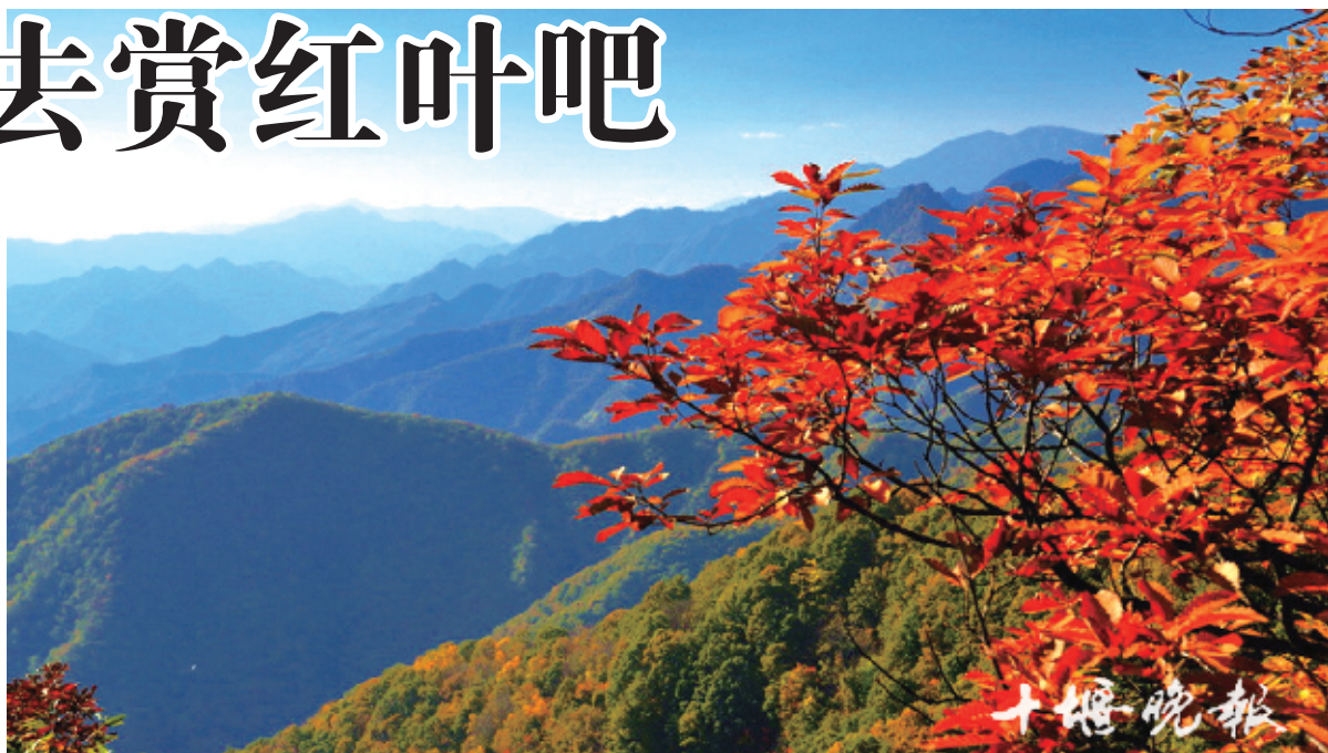
秋日在神农大峡谷登高欣赏美景。