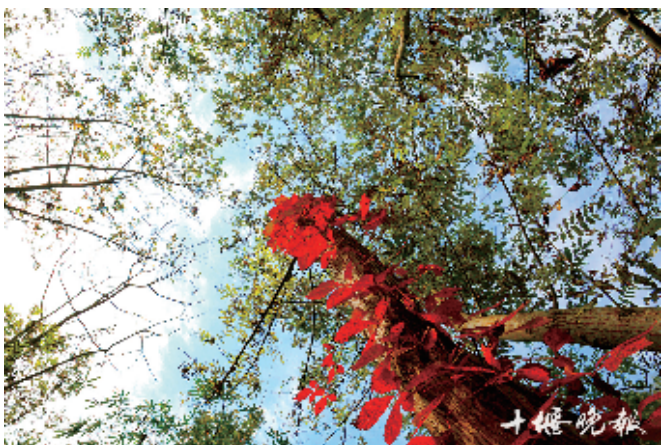
太和梅花谷红叶和绿叶交织在一起。