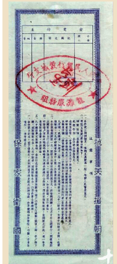
中国人民银行湖北省分行郧阳中心支行发行的“有奖定期储蓄存单”，正面印有“增产节约”字样，背面印有“抗美援朝，保家卫国”字样。