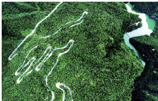
《绿的旋律》