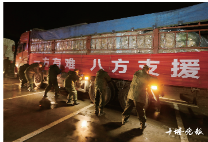
疫情期间,全国各地的支援物资源源不断送到十堰,帮助市民战胜疫情。