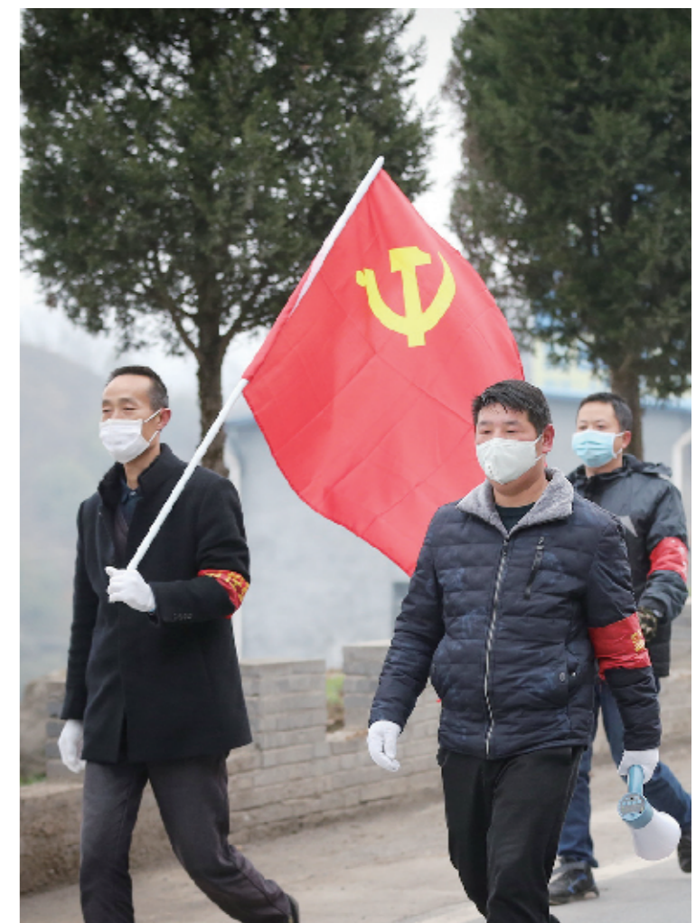
2月8日,郧西县土门镇党员干部组成的宣传小分队走村串户,宣传防疫知识和相关通告。疫情期间,广大党员主动请战,党旗飘扬在每条抗疫战线上。