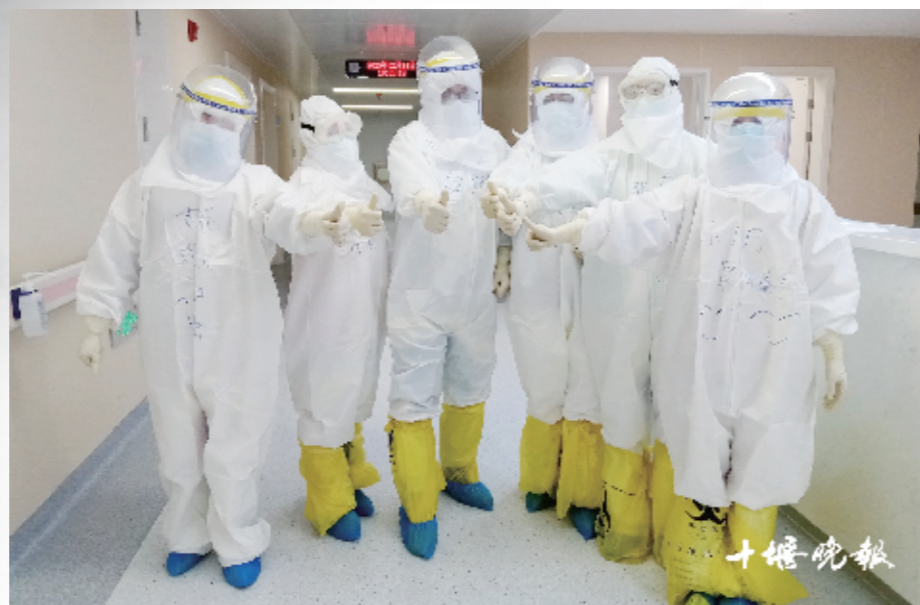
在密封闷热的防护服和面罩下,我们无法看清这些奋战在抗疫高危地点的医务工作者的面容,但是我们知道他们有一个共同的名字——“抗疫英雄”。