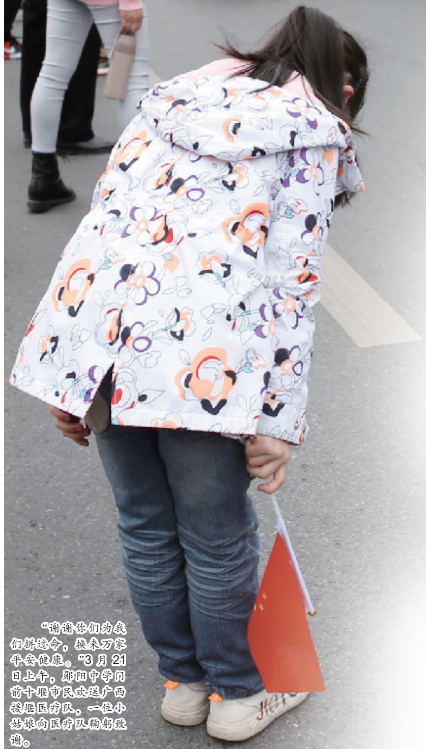
“谢谢你们为我们拼命,换来万家平安健康。”3月21日上午,郧阳中学门前十堰市民欢迎广西援鄂医疗队,一位小姑娘向医疗队鞠躬致谢。