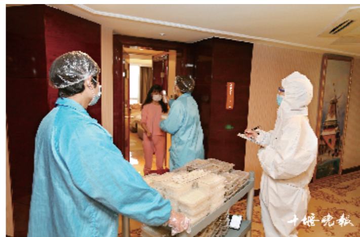
3月7日,绿洲美景酒店内,工作人员为滞留十堰的旅客测量体温和送餐。众多志愿者默默奉献,为人们的生活提供各种帮助。