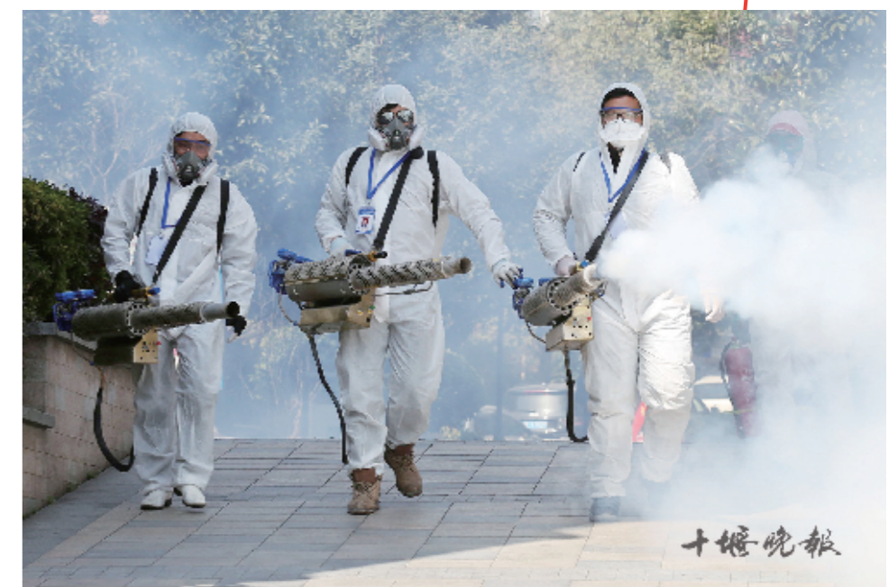
2月25日,8名义务消杀队员在小区消毒。戴口罩、测体温、消毒成了抗疫期间最热的词汇。