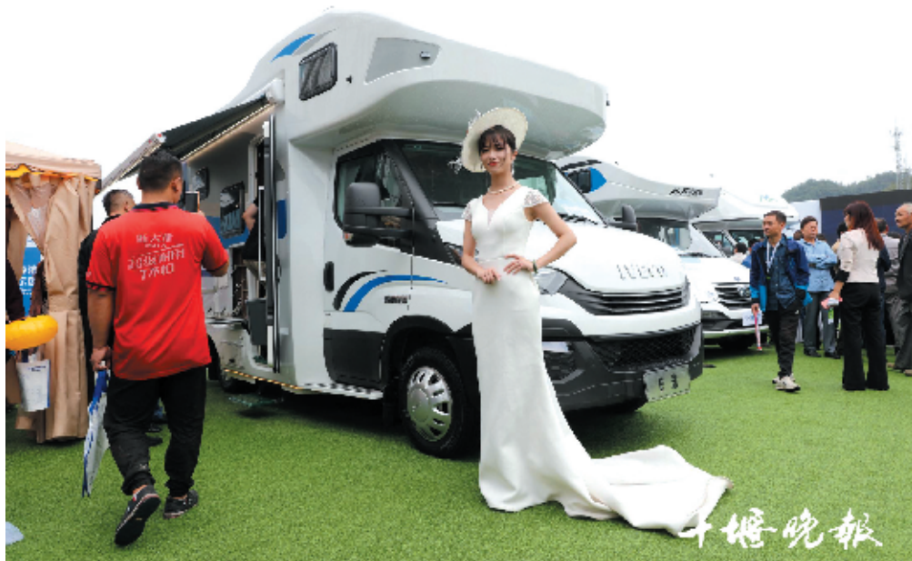
近年来,房车成为汽车市场新宠,每次参展都能吸引一大批市民围观。