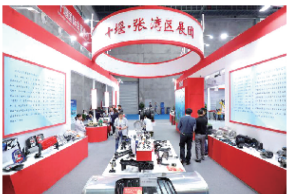
各县市区展区特色将更加鲜明。

申龙进气系统等23家单位参展,产品涉及电子传感器、集成线束、工程塑料件、汽车变速换挡器、铸件、新能源汽车三电系统,以及排放处理系统、液压油缸、座椅、滤清器、同步器、控制器、方向盘、仪表盘、汽车前后桥总成等百余种汽车关键零部件和总成系列产品。