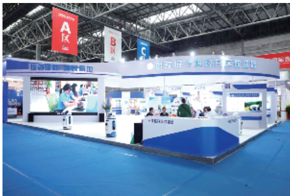
此次会展面积达5万余平方米。

此次交易会,茅箭区有驰田汽车、同创传动、正奥附件、迅捷安应急装备、双鸥饰件、坤钰饰件、百懋科技、众柴发动机部件、和德工业、杰鼎油缸、