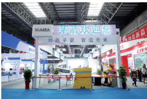
全国各地300余家参展企业将亮相本次展会。