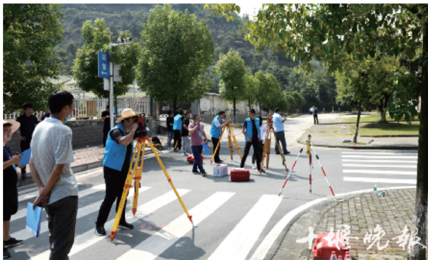
竞赛采取理论考试和技能操作考核相结合的方式。