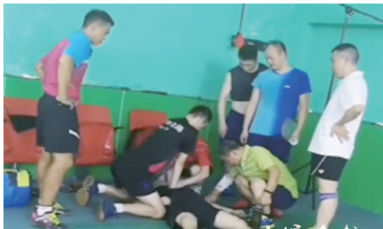
医生球场边急救陌生球友。