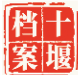
十堰市档案馆 十堰晚报 联办