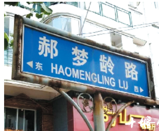
武汉汉口有一条郝梦龄路，它是以抗日名将郝梦龄将军名字命名的。