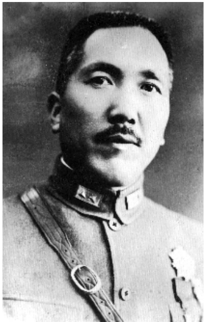
藏于十堰市档案馆的郝梦龄遗照复制件。