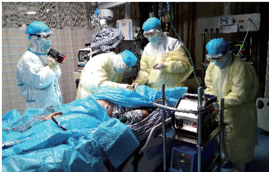
南昌大学第一附属医院象湖院区重症监护室的医护人员在救治一名新冠肺炎重症患者(资料图片)。