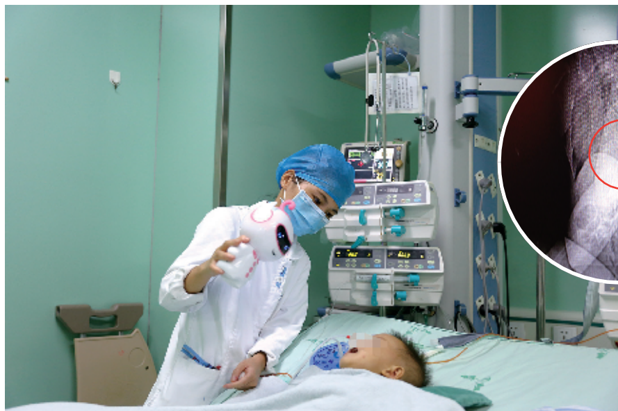
在 PICU, 医护人员精心照看佳佳, 不时用玩具逗她开心。