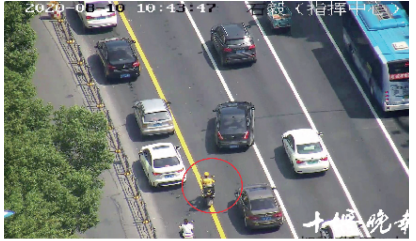
监控拍下的外卖骑手交通违法行为。