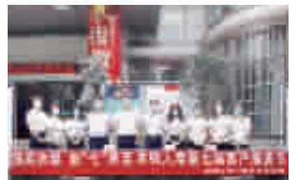
农银人寿十堰中支开展“客服节”、“7.8保险公众宣传日”宣传活动。

农银人寿十堰中支本次客户服务节以创新形式,为客户提供涉及文化、健康、法律、教育、经济等多方位、