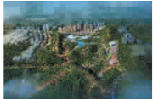
国瑞文旅城效果图