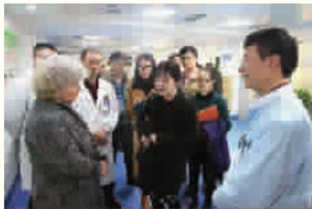
CARF的专家在太和医院审核。