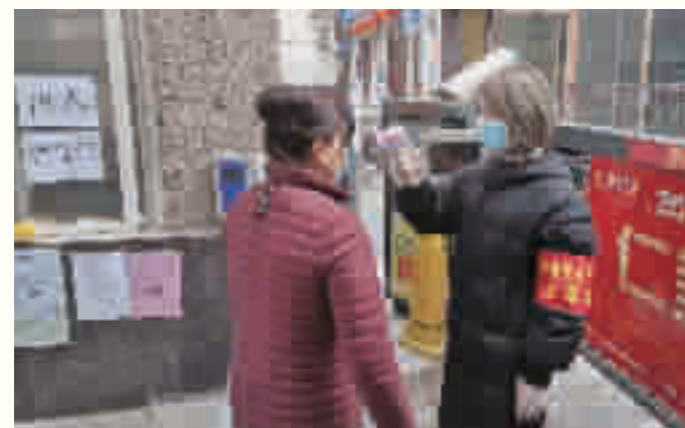
党员干部下沉社区,守牢居民健康防线。