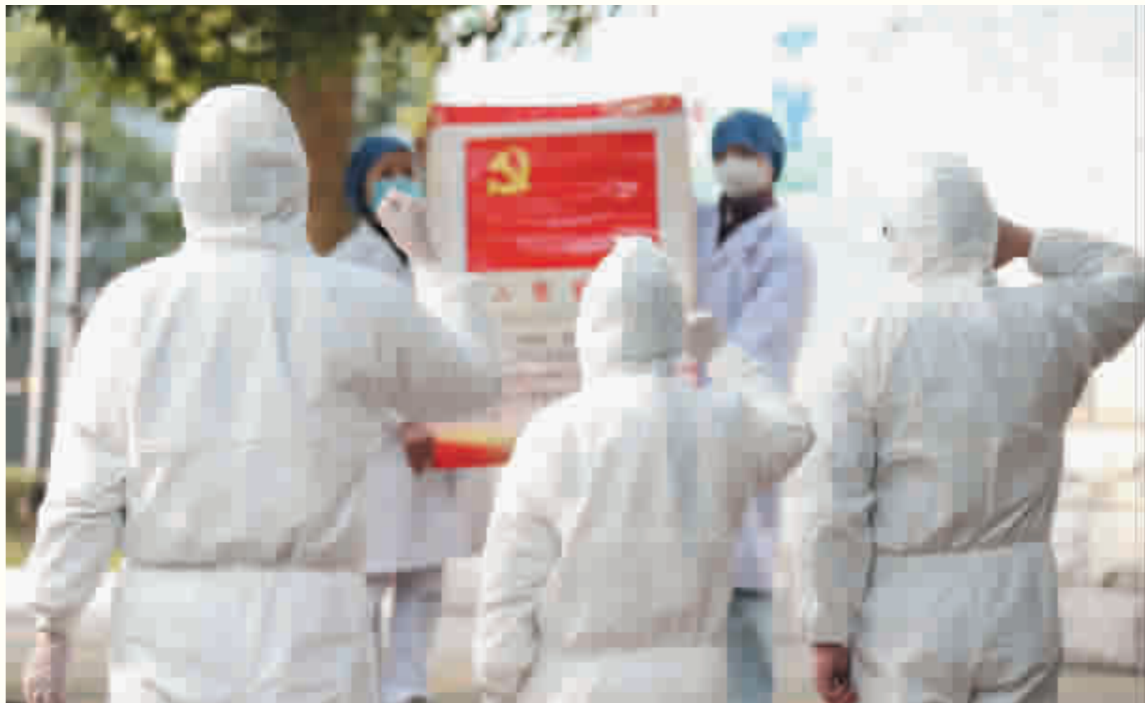
2月2日下午,3名奋战在抗疫一线的西苑医院医护人员面对党旗宣誓入党。