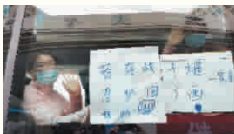
3月21日,支援十堰的广西医疗队与十堰市民告别。

“2020年1月,新冠肺炎疫情迅速蔓延。在这次史无前例的抗击疫情战役中,350万十堰人在市委、市政府的统一领导下,凝神聚力、全面出击,取得了抗击新冠肺炎疫情的决定性成果。”