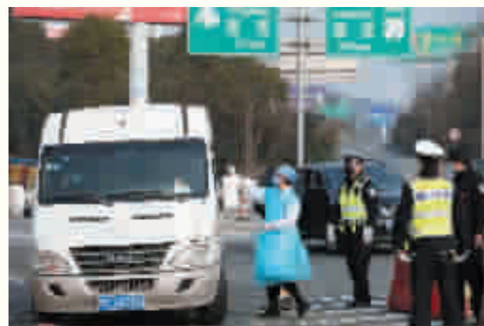
2月3日,十堰东高速入口,对出入车辆进行严格检查。