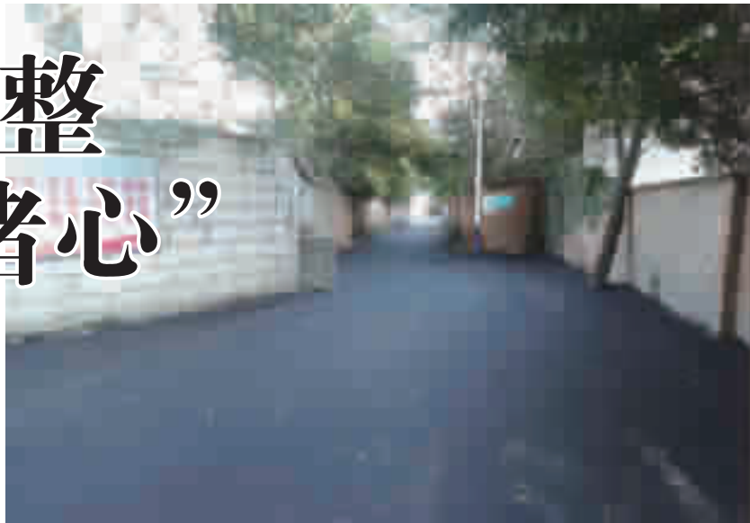
修复平整的力勤路。