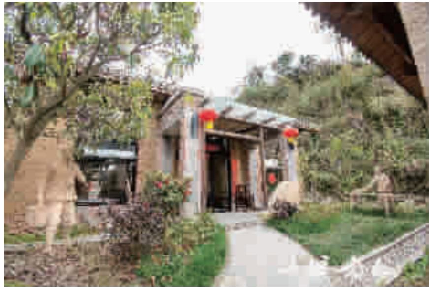
竹溪桃花岛民宿外景。