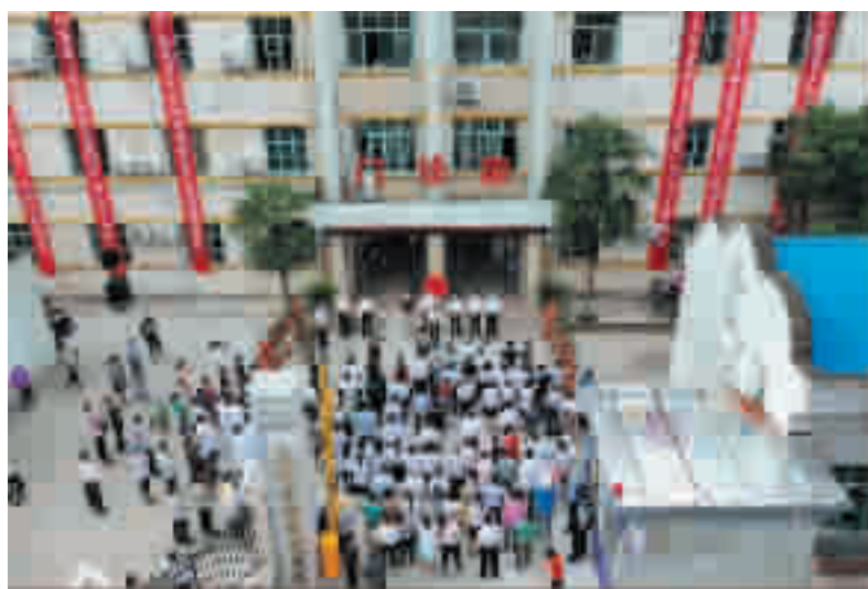
开诊仪式现场活动吸引不少市民参与。