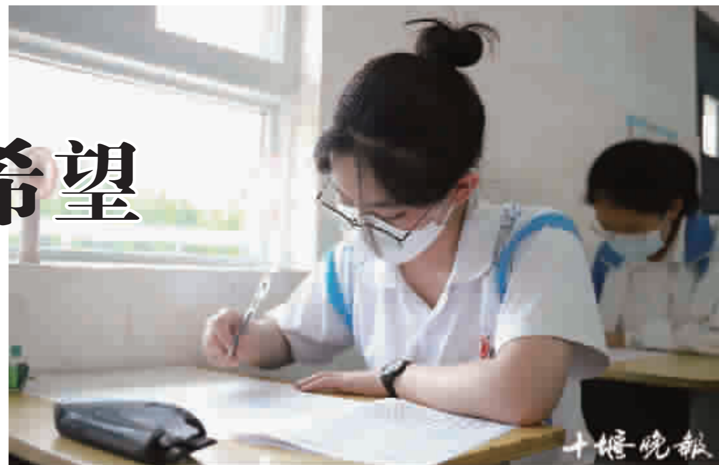
今日在东风高中,他日回报祖国。