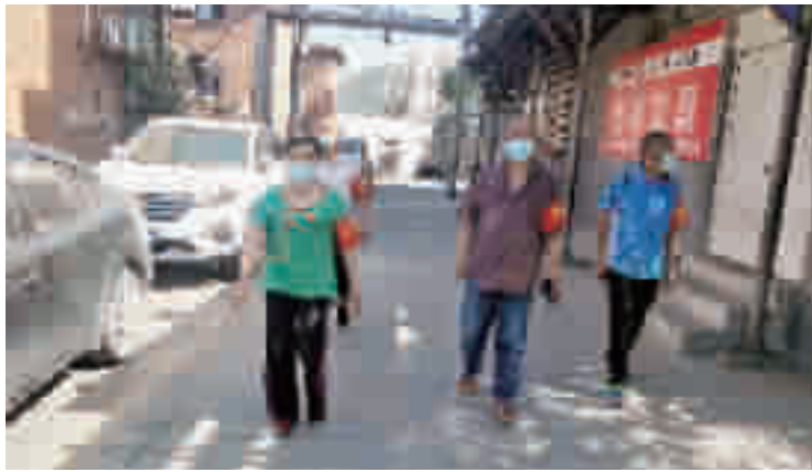
老年志愿服务队伍正在开展巡逻。