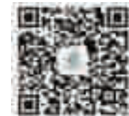
中国邮政储蓄银行 十堰市分行

用随支,详询可电联咨询:十堰营业部:8676679 13886836110 人民南路支行:13329851515 人民北路支行:13797819712 顾家岗支行:13669099677