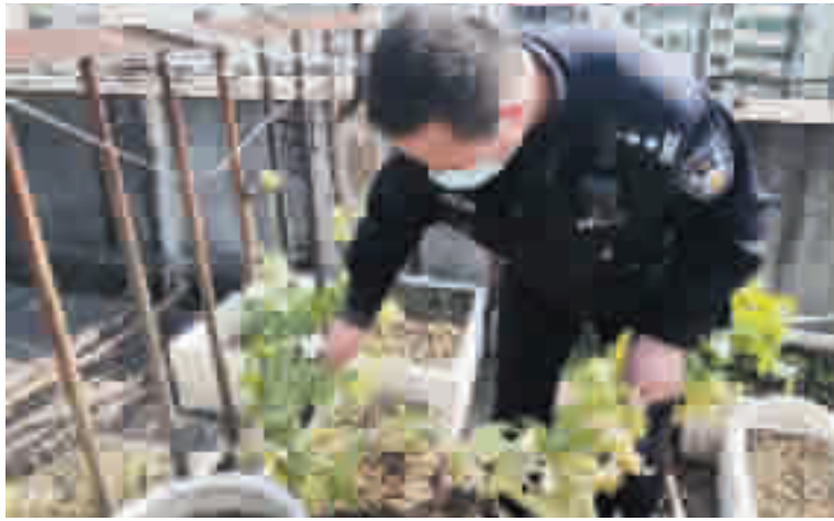
民警将居民种植的罌粟拔掉。