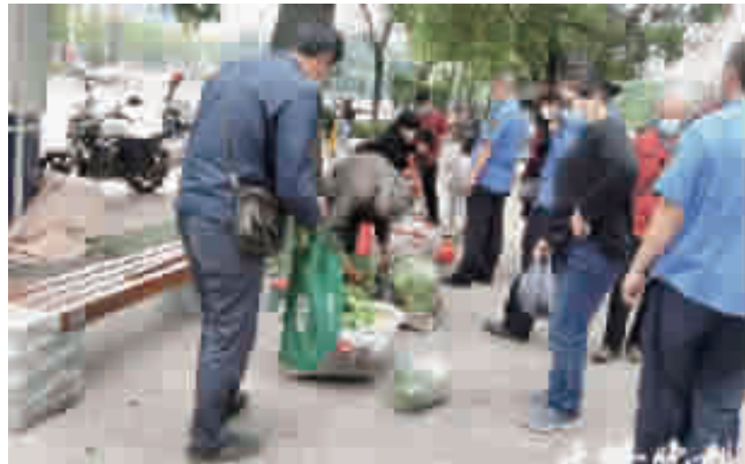
执法人员清理校园周边流动摊贩。

据悉,通过“十堰头条”客户端“微文明·随手拍”活动页面上传的作品,成功上传后即可参与幸运大转盘抽奖活动,有机会获得价值10元、20元的奖品或价值50元的购物卡。活动主办方也将根据“微文明·随手拍”作品的质量分别评选出月度、年度优秀随手拍作品,年度优秀作品最高可获得千元现金奖励,诚邀广大市民积极参与。