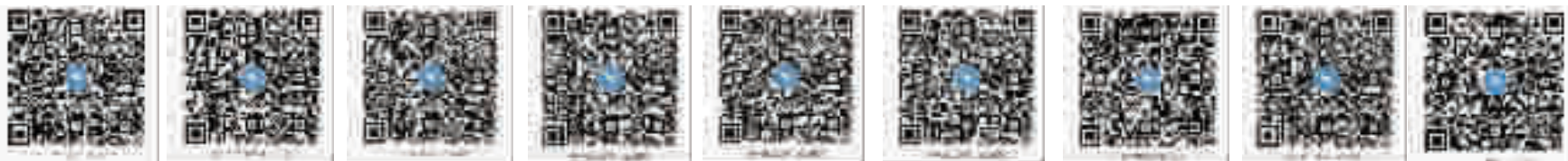
全市一年级答疑钉钉群 全市二年级答疑钉钉群 全市三年级答疑钉钉群 全市四年级答疑钉钉群 全市五年级答疑钉钉群 全市六年级答疑钉钉群 全市七年级答疑钉钉群 全市八年级答疑钉钉群 全市九年级答疑钉钉群