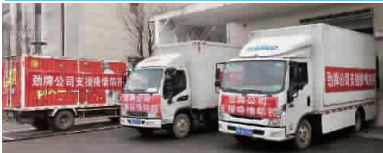
公司作为劲牌十堰合作伙伴响应市委市政府和劲牌总部号召积极捐款捐物。