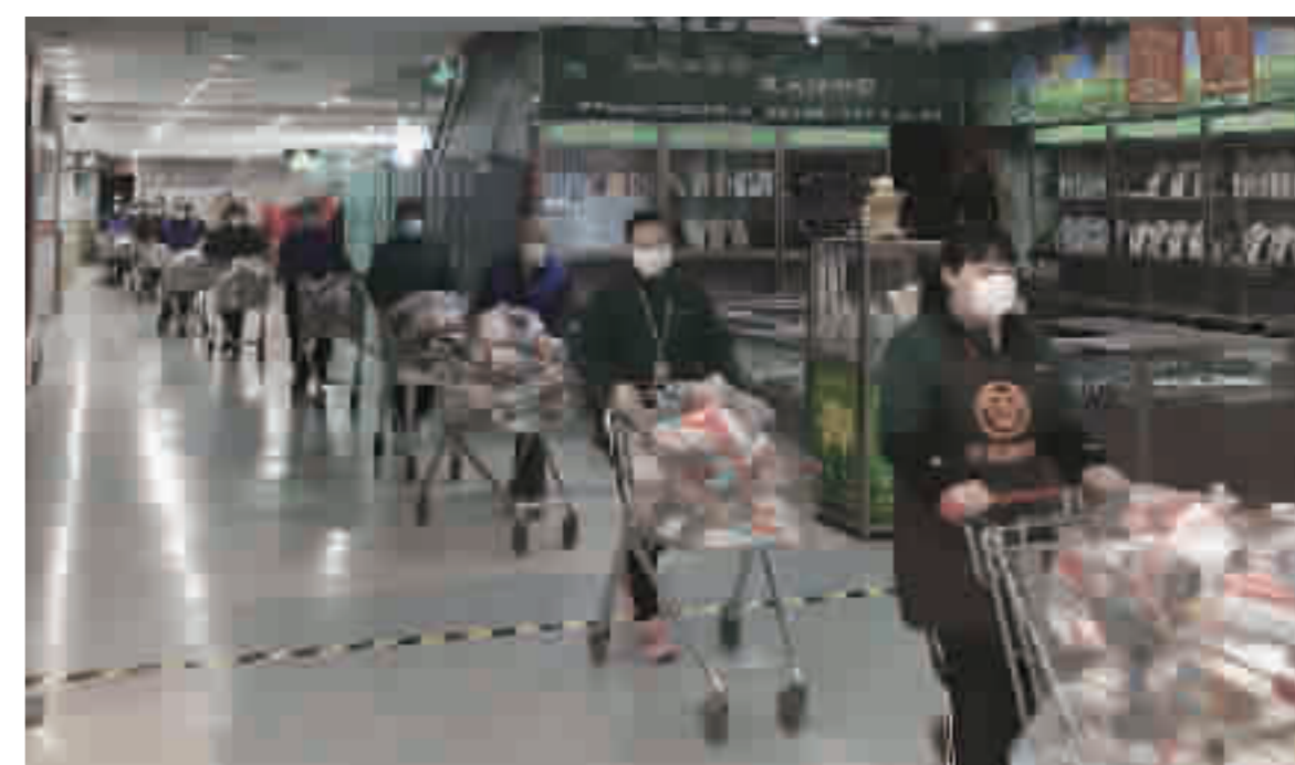
武商超市开通社区“无接触配送”业务。

以顾客需要为追求,以服务顾客服务城市为使命。有了十堰人商这样的坚守者默默滋润着这座城市,我们必将迎来春暖花开的美好时光。