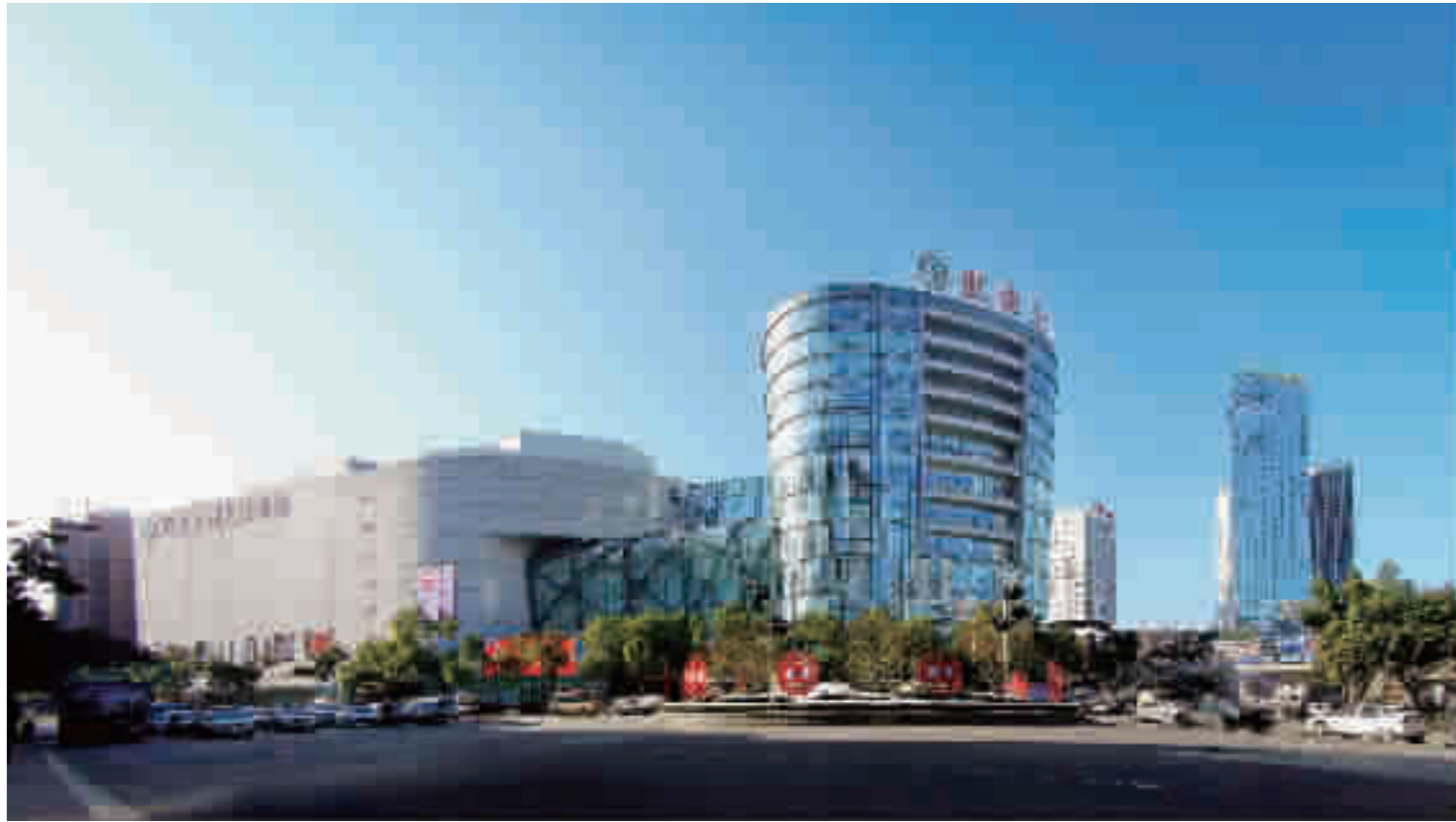
十堰人商用实际行动彰显了区域龙头企业的责任和担当。

新冠肺炎疫情突如其来,没有旁观者,更没有局外人。抗疫阵前,武商集团十堰人民商场肩扛责任,主动作为,保供应、稳物价、惠民生、献爱心,用实际行动彰显了区域龙头企业的责任和担当。十堰人商更是用实际行动证明,无论时代如何发展、无论形势如何变化,他们为消费者提供优质商品和优良服务的初心永远不会改变。