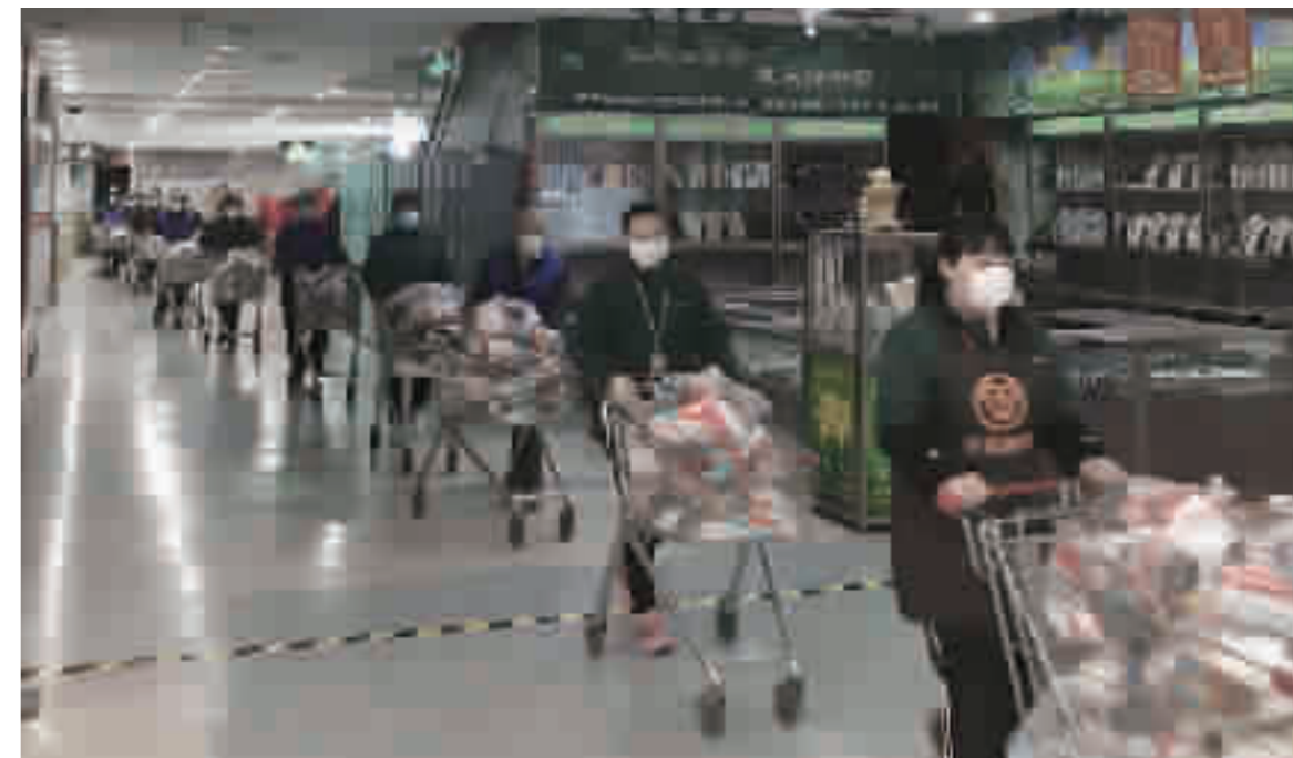
武商超市开通社区“无接触配送”业务。

以顾客需要为追求,以服务顾客服务城市为使命。有了十堰人商这样的坚守者默默滋润着这座城市,我们必将迎来春暖花开的美好时光。