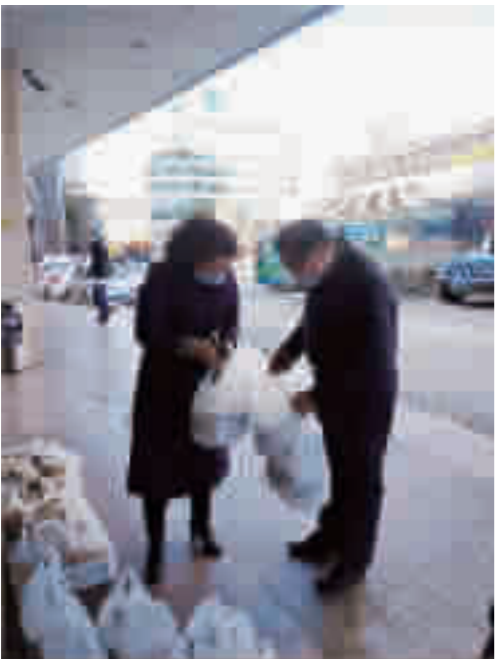
人商偏爱臻咖啡西餐餐厅工作人员为太和医院一线抗疫人员送去爱心咖啡和面包。