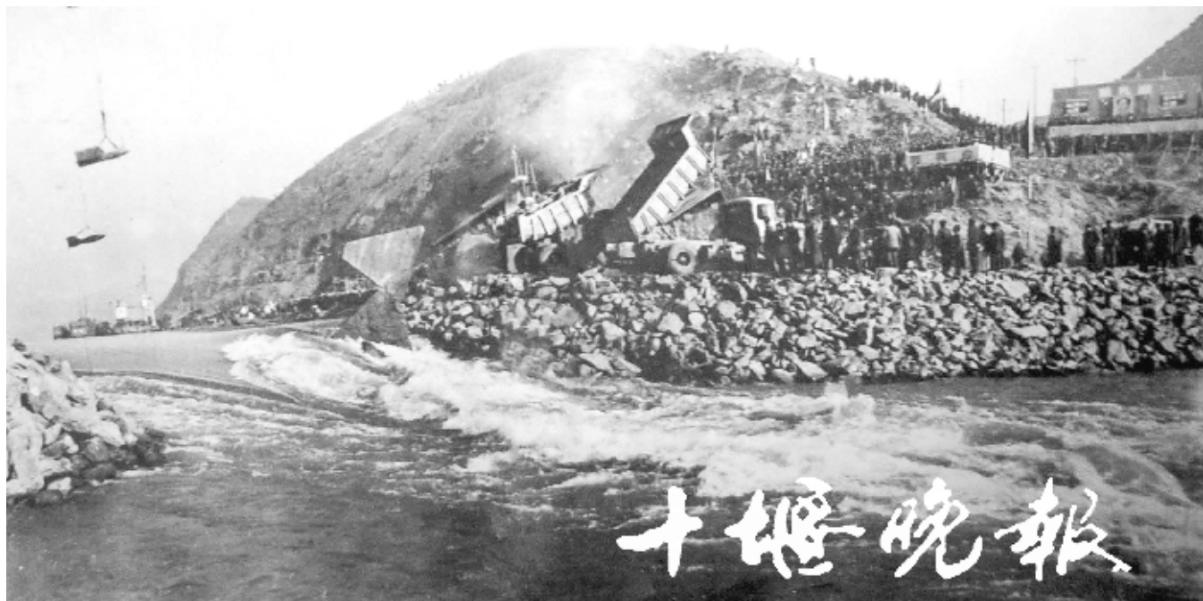
1959年12月26日,汉江截流成功。