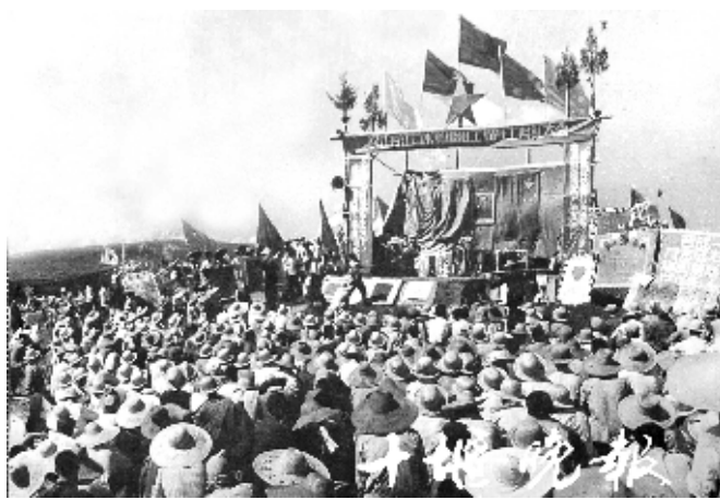
1958年9月1日,丹江口水利枢纽工程举行了盛大的开工典礼。