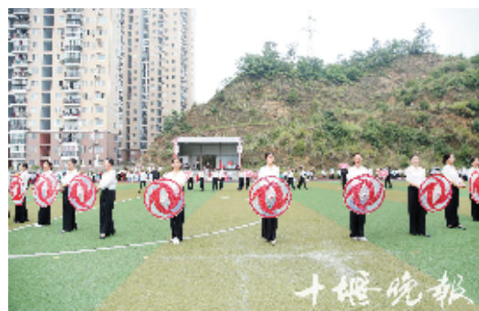
模特队队员们在节目中排出“50”、“70”的造型。