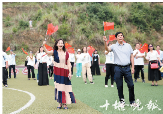
尽管排练很辛苦,但是大家情绪饱满,充满热情。