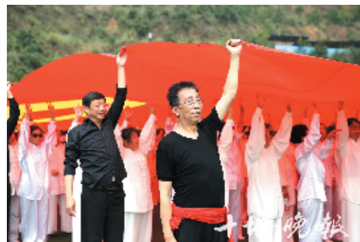
排练中,大家十分认真,尽量做好每一个动作。