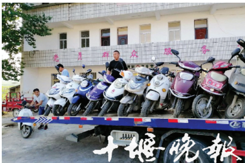
警方追回的被盗车辆。