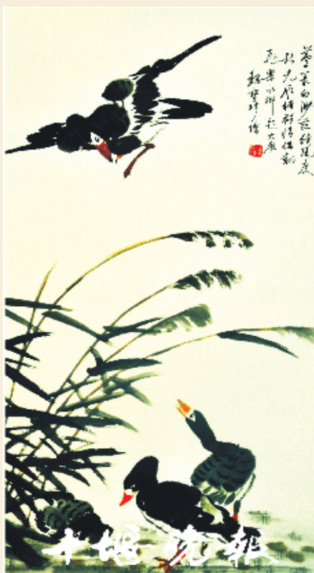
《大雁图》 魏宝珍 作