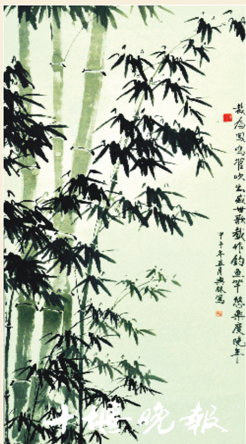
《东风劲吹千竿竹》 周兴林 作