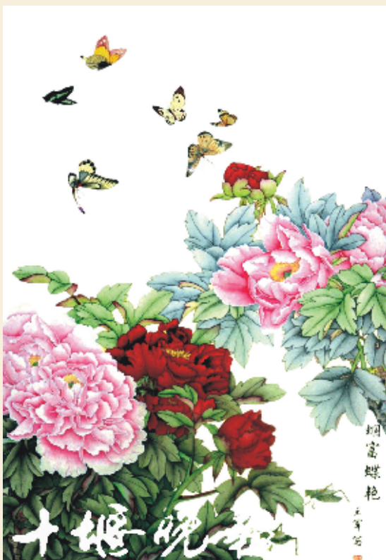
《烟富蝶艳》 王军 作