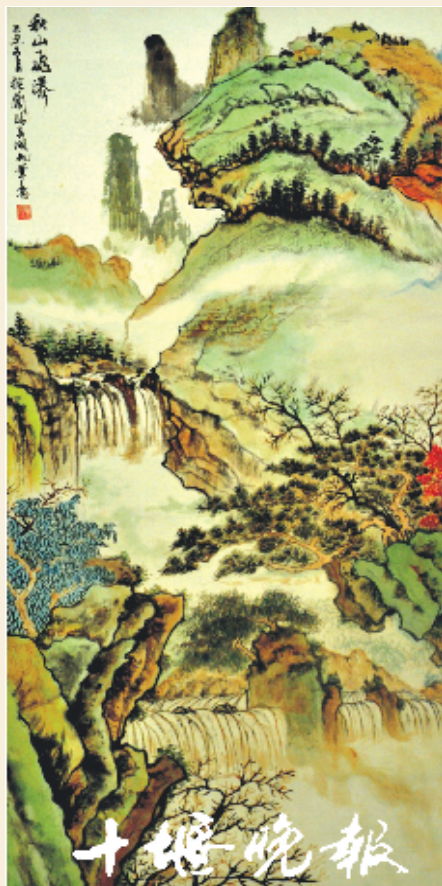
《秋山飞瀑》 王桂兰 作