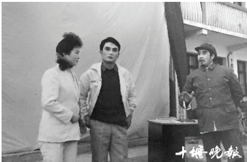
1994年,市豫剧团在张湾区茅坪巡回演出。