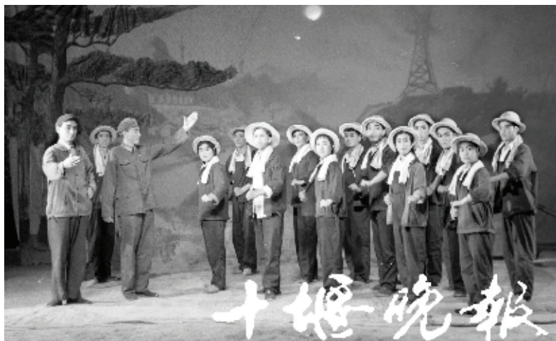
二汽工人演出革命样板戏。