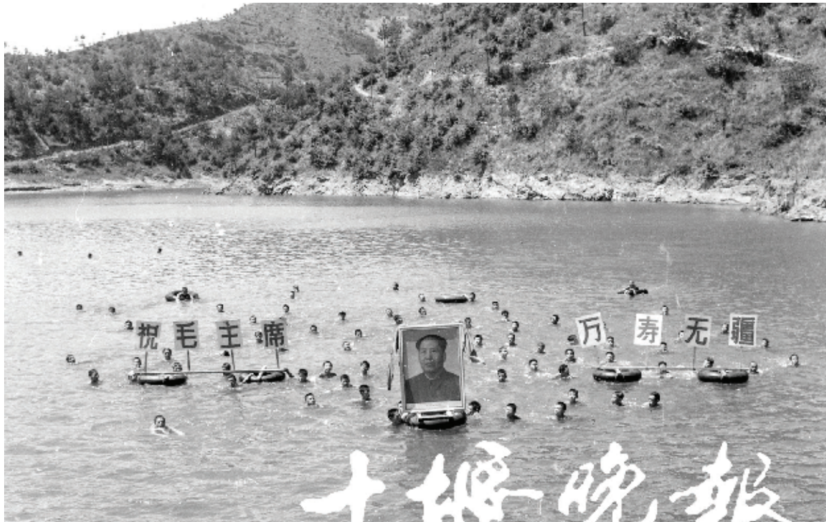
1971年6月28日,红卫厂在大岭沟水库举行游泳活动。