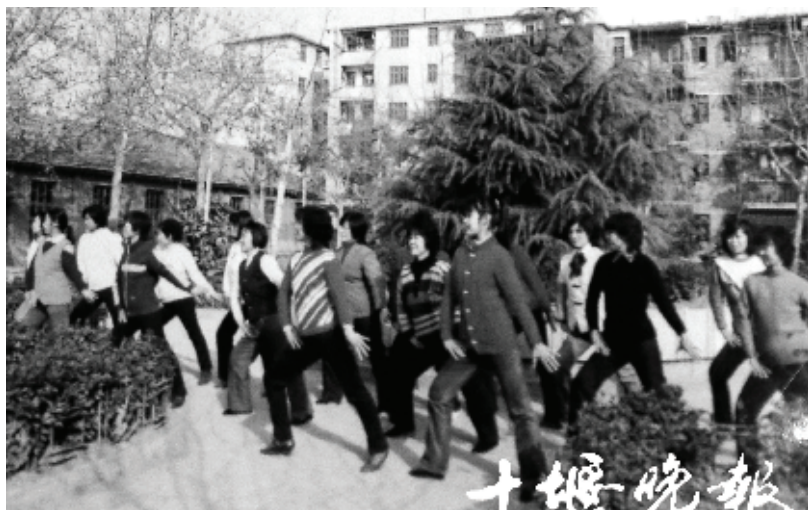
1993年,张湾区女子健身操培训。