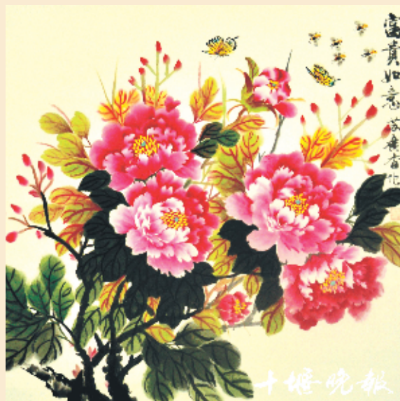
《富贵如意》苏广香作

如今的老年人,退休生活越来越丰富多彩,除了读报、看书、跳广场舞,很多老人还不甘寂寞,去老年大学学书法、学摄影来陶冶情操。以书画会友,真是不错的选择。老人们一起交流书画创作心得,挥毫泼墨,创作了不少书画作品,通过书画作品展示了他们的艺术功底,也展现了老人们的精神风貌。